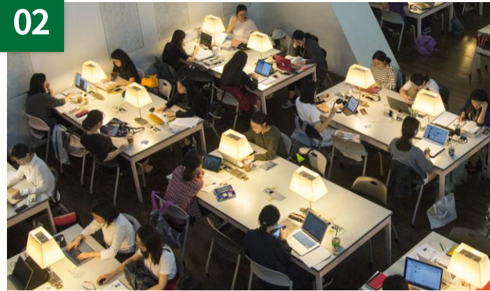
韓国語能力向上支援 TOPIK試験料支援、TOPIK準備クラス受講料支援