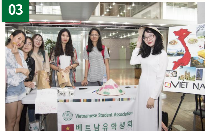
国家別留学生会活動の支援