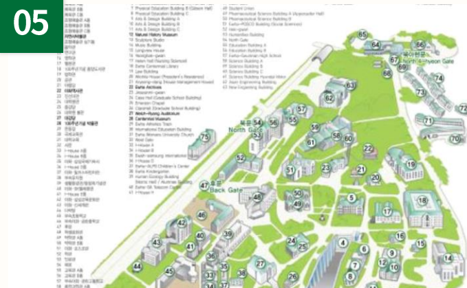
外国人留学生ハンドブック製作配布