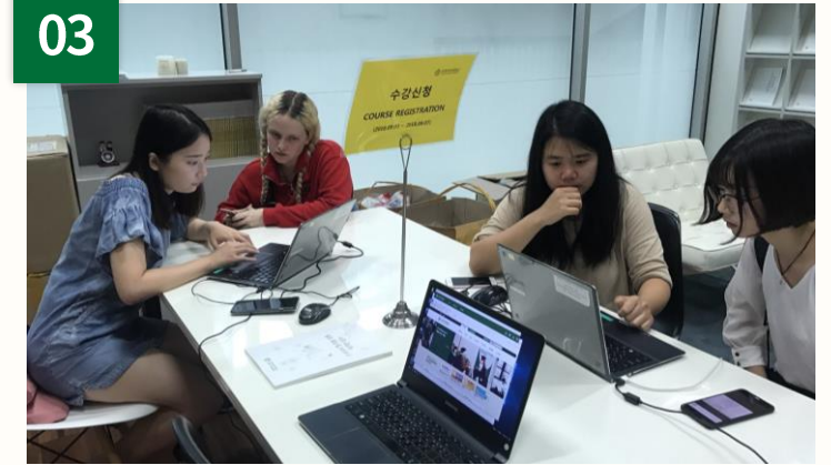
受講申請援助制度運営