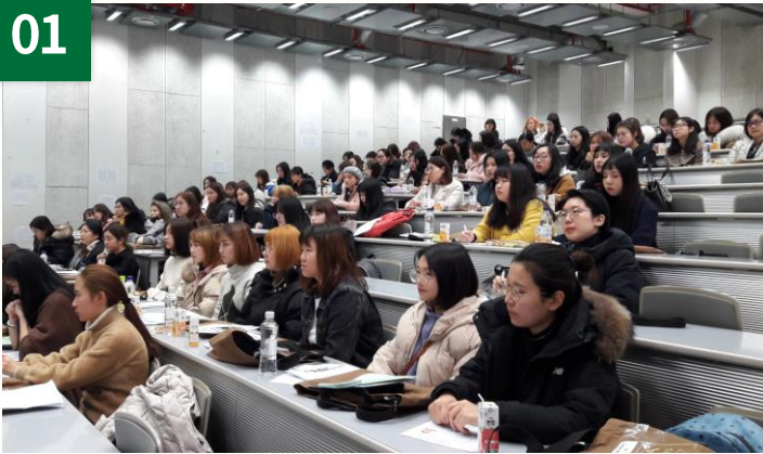
毎学期外国人新入生を対象にオリエンテーションを進行 韓国語、英語、中国語進行