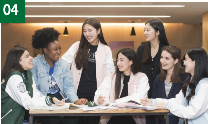
EwhaMate : 学部新入生全員対象のメントマッチング