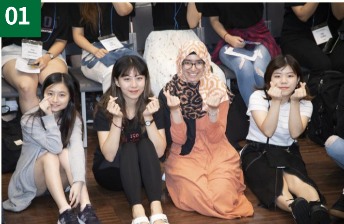
外国人登録・ビザなど在留関連支援