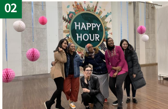
毎学期ハッピーアワー行事を開催、 韓国文化体験活動など