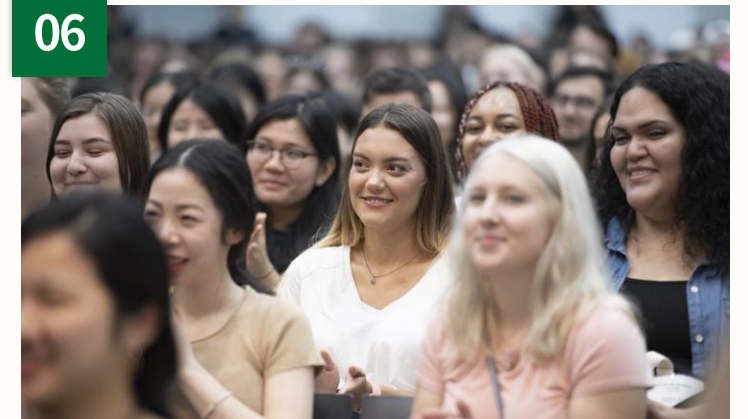
学科別外国人留学生懇談会への財政支援