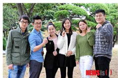
부경대 중국 유학생 6명, 삼성전자 중국법인 취업 기사등록 일시 2019-09-25 11:23:15

한국에서 취업을 희망하는 외국인 유학생을 위한 강좌(취업한국어, 글로벌취업전략), 인턴 및 취업 정보 제공(2013년 서안 삼성전자 본교 졸업생 12명 취업)