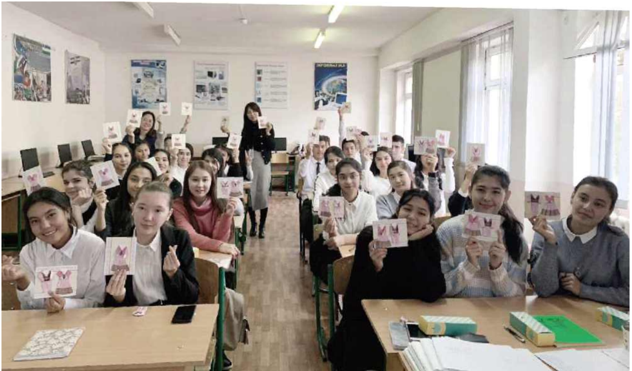
[우즈베키스탄 현지 한국어 특강]