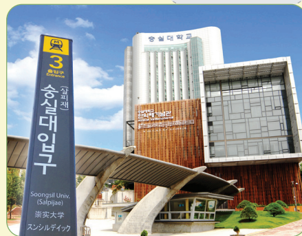
崇实大入口站 (七号线)