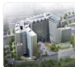
Soongsil Residence Hall I