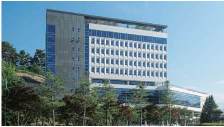
三陟校区(含道溪) (面积630,517㎡)