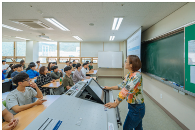
先进教室/综合教室 473/533个(89%)