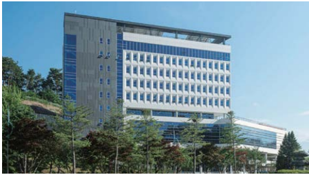
三陟校区(包括道溪) (面积630,517㎡)