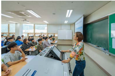
尖端教室数量/教室总数量 473/533间(89%)