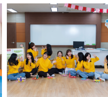
Department of Childhood Education