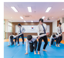
Department of Police Administration