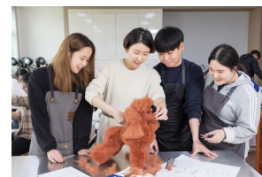
Department of Companion Animal