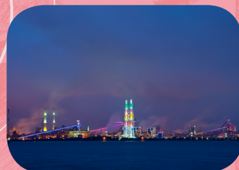
Yeongildae-Pavilion & Nightscape of POSCO