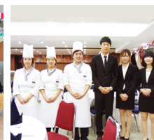
Department of Hotel & Restaurant Management