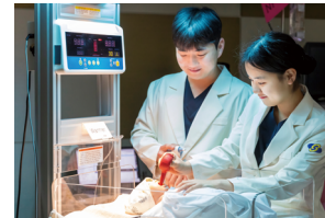
Department of Nursing Science