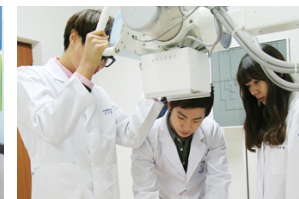
Department of Radiology