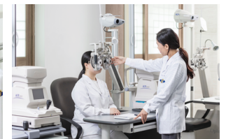
Department of Visual Optics