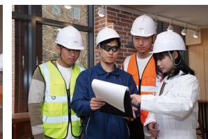
Department of Health & Industrial safety engineering