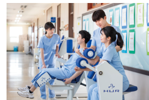
Department of Physical Therapy