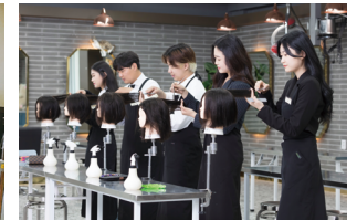
Department of Beauty Design