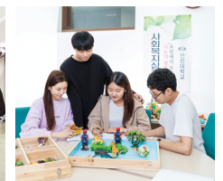
Department of Social Welfare