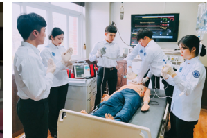
Department of Emergency Medical Technology