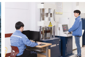
Department of Mechanical ENG for Steel & Manufacturing