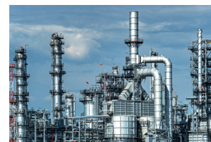
Department of Steel Industry